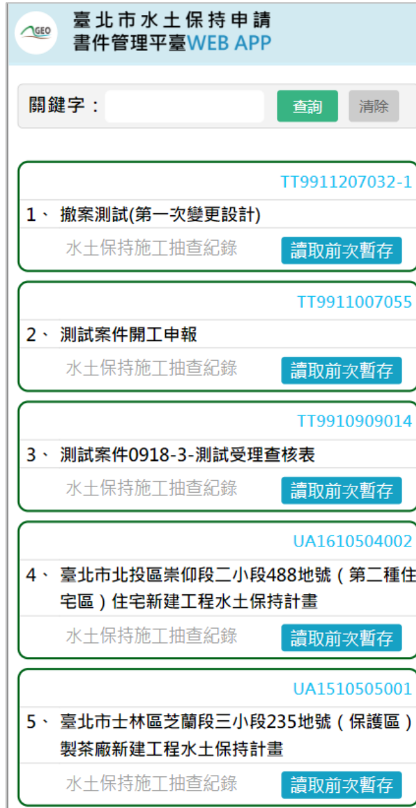
圖 7：個人案件管理列表

成功登入後，即進入個人案件管理列表頁面中，提供使用者所負責之各案件「水土保持施工抽查紀錄」，並提供關鍵字查詢功能，以便使用者快速查找欲填登抽查紀錄的案件。