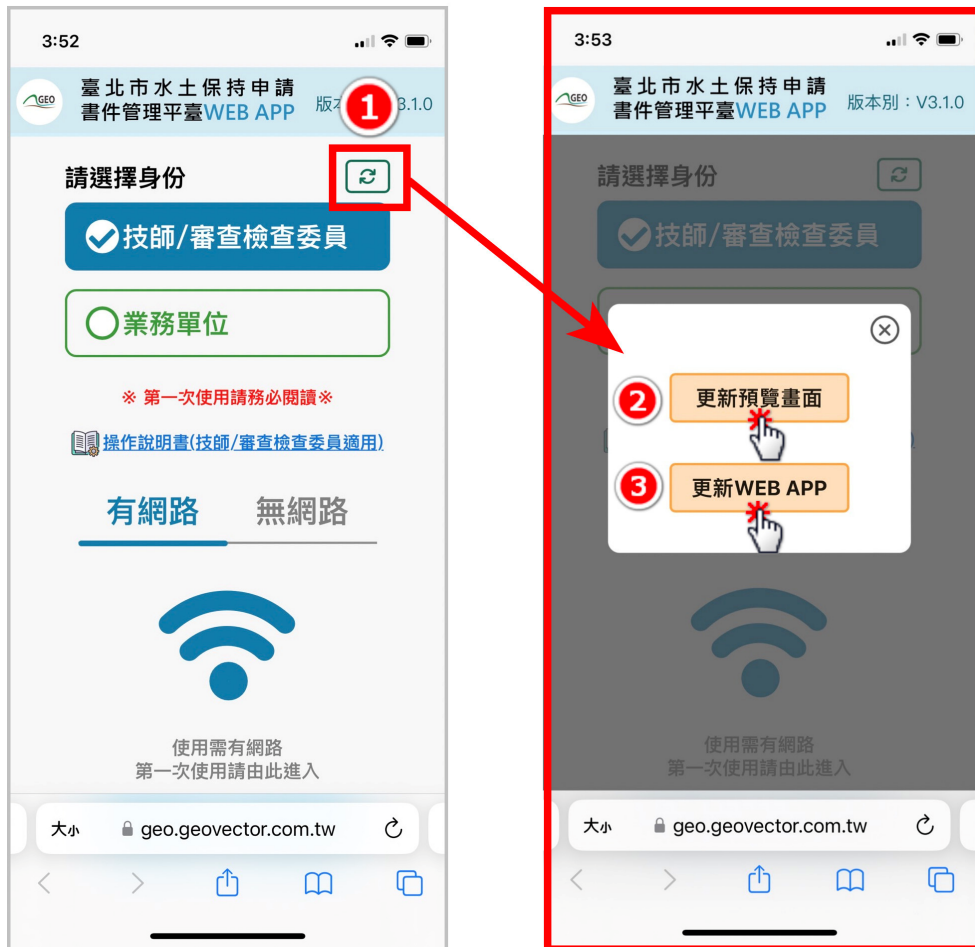
圖 2：「更新預覽畫面」與「更新 WEB APP」於首頁右上方

清除完裝置快取後，請重新進入書件管理平台 WEB APP，請點選右上方更新圖示，點下後畫面出現「更新預覽畫面」及「更新 WEB APP」兩顆按鈕。