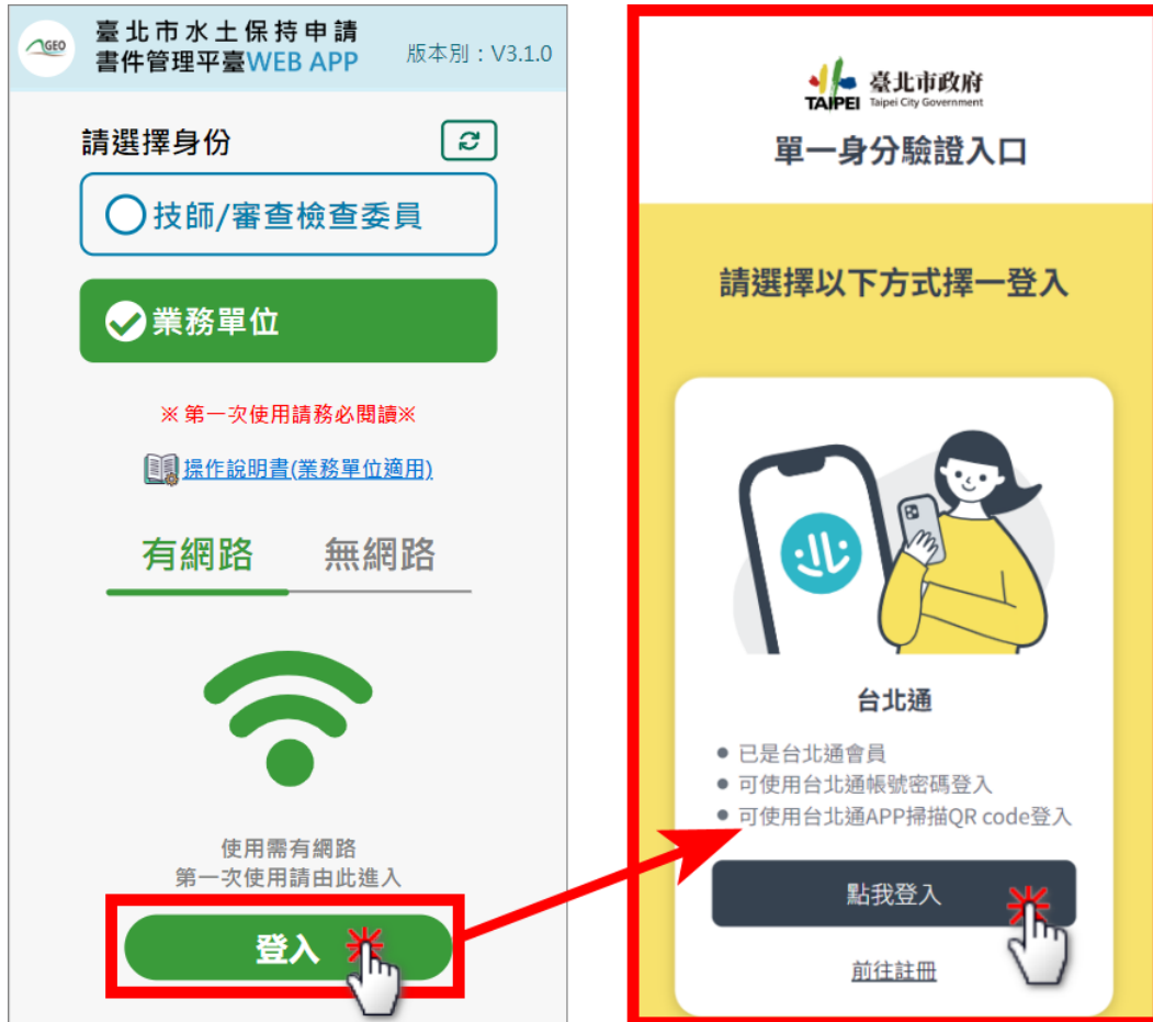
圖 6：行動裝置書件平台登入畫面

點選「登入」後，系統即會導向「台北市政府單一身分驗證入口」， 使用者即可使用台北通或行動自然人憑證方式進行登入。