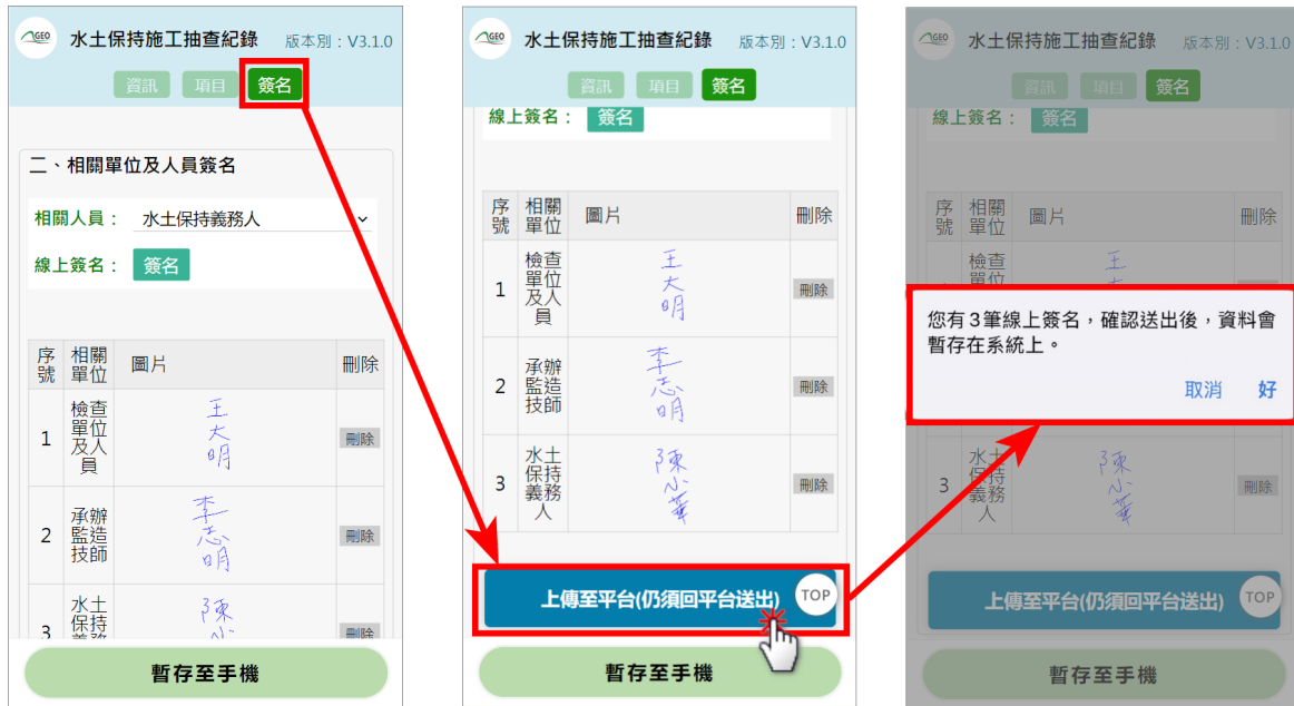
圖 19：檢查表單上傳至平台

若欲將填登完畢之檢查表單上傳至平台，請務必確認您在有網路的環境下操作。表單填寫完畢欲上傳至平台時，點選「簽名」頁籤後，往下至網頁底部點選「上傳至平台（仍須回平台送出）」，系統將提醒目前共有幾筆簽名，於確認無誤後，表單即上傳至「臺北市水土保持申請書件管理平台」。